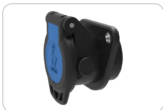
Socle de parc EXPERT EXPERT parking socket