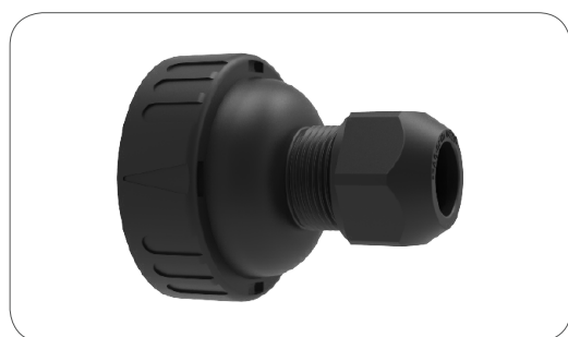
Sortie à baïonnette pour connexion sur câbles de diamètre: Bayonet cap for cable with diameter: