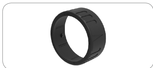
Verrouillage à baïonnette pour raccords sur gaine annelée bayonett ring for corrugated tube outlet