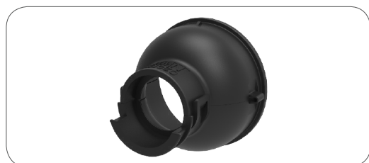
Raccord pour gaine annelée 180° (rotation libre de 360°) 180° corrugated tube outlet (freely rotated by 360°)