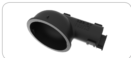
Raccord pour gaine annelée 90° (rotation libre à 360°) 90° corrugated tube outlet (freely rotated by 360°)